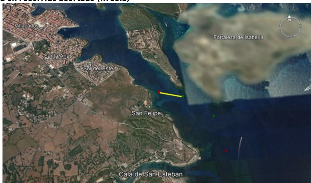
Línea de llegada en recorrido acortado (IR 10.2)