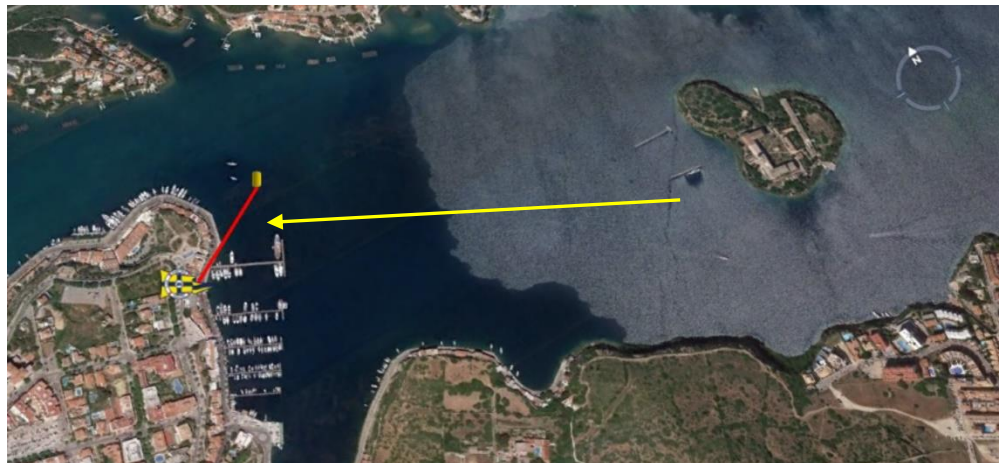
Línea de Llegada

La línea de llegada estará determinada entre una baliza cilíndrica de color naranja en el extremo de estribor y el edificio del Club en el extremo de babor